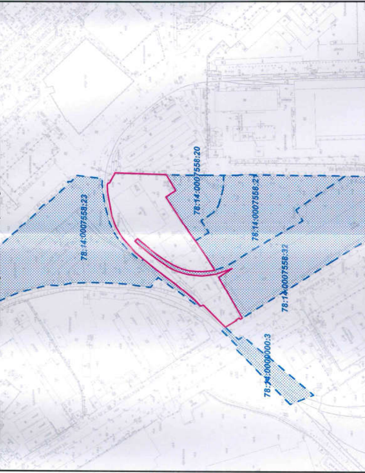
Схема расположения земельного участка в окружении смежно расположенных земельных участков (ситуационный план), М1:4000

- смежные земельные участки, прошедшие государственный кадастровый учет